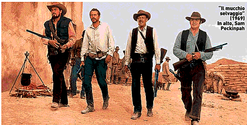
"Il mucchio selvaggio" (1969) In alto, Sam Peckinpah