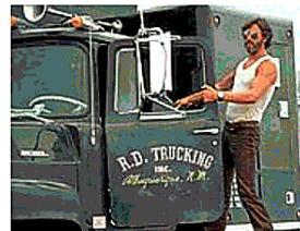
Kris Kristofferson in "Convoy" (1978)

nell'alta sierra" e "Sierra Charriba", anche se non molti ricordano che a un debuttante Peckinpah si deve la sceneggiatura del memorabile "Invasione degli ultracorpi" (alieni nascosti in leggendari bacelloni) firmato da Don Siegel di cui Sam fu a lungo aiuto. "Il mucchio selvaggio", cast stellare, uno dei migliori western di tutti i tem-