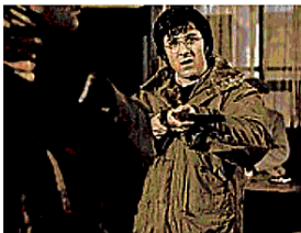
Dustin Hoffman in "Cane di paglia" (1971)