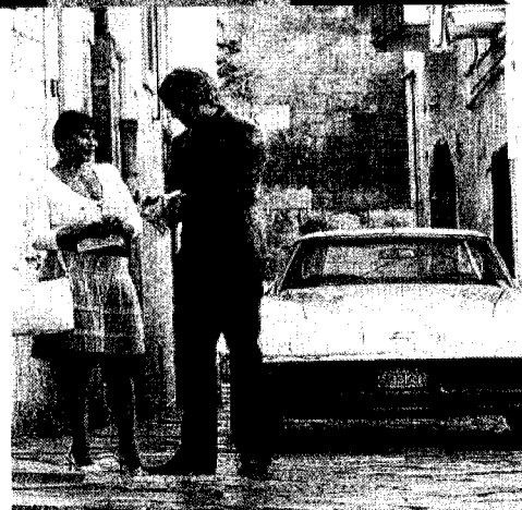
«SALENTO FINIBUS TERRAE» Il filmfestival internazionale del cortometraggio si svolgerà in cinque località salentine dal 17 luglio al 1° agosto